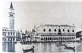
VENEȚIA. — Palatul Ducal.

Am ajuns într-o seară la Veneția, orașul clădit pe lagună, falnică republică de odinoară, în care încă se mai respiră aelul gloriei apuse. Am vizitat Ca d'oro, biserica San Marco și palatul dogilor. Înănturul acestuia mi-am adus aminte de soarta sângeroasă a lui Marino Falleri, care voină să introducă tirania, în spiritul republican de-atunci, a