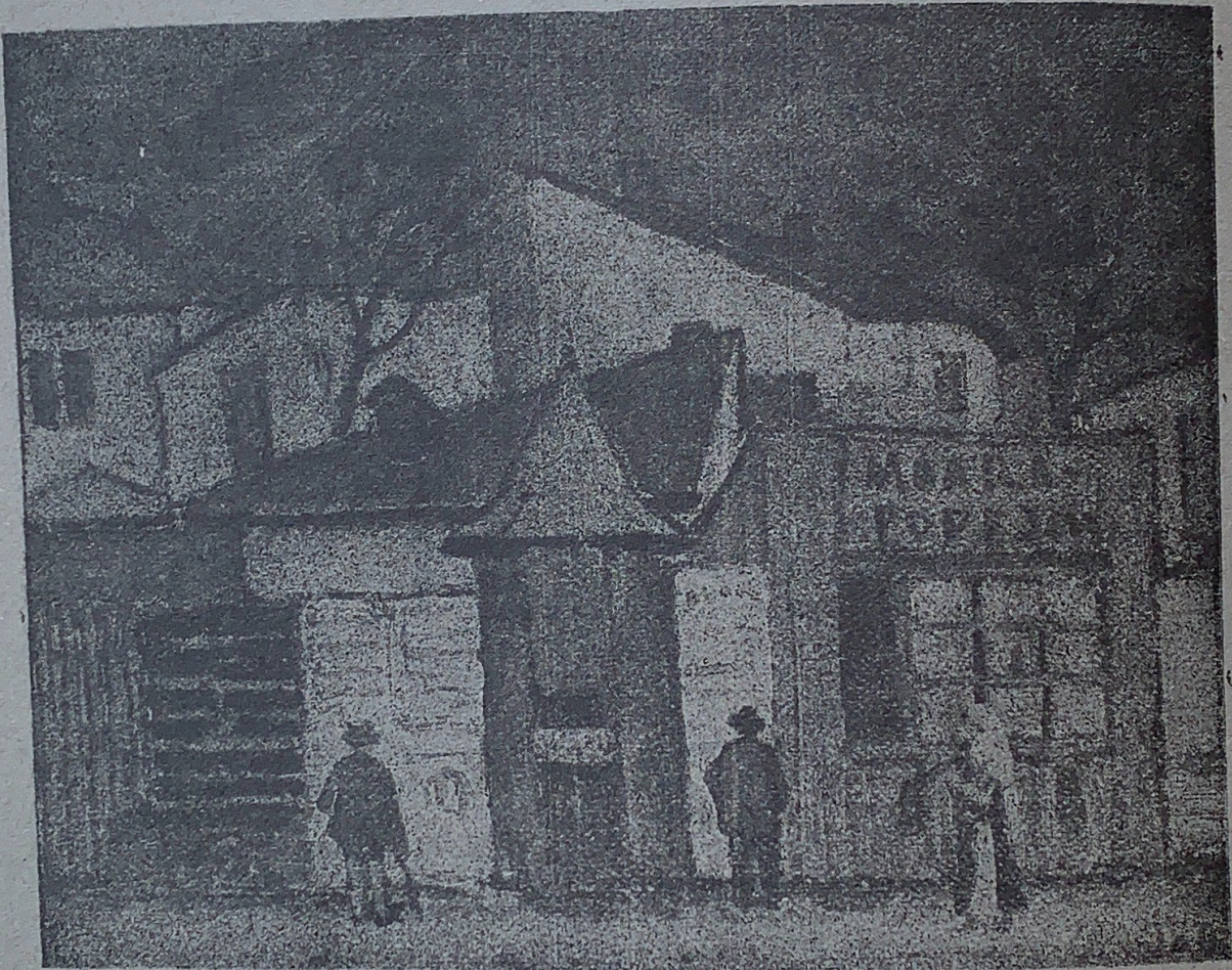
COLȚ DIN BUCUREȘTI. PICTURA DE D. GHIȚĂ.