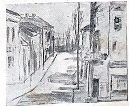
Peisaj. — Ionescu Sorin.