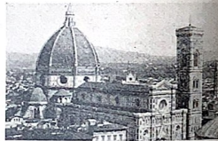
FLORENȚA. — Catedrala.

Deși nu era o distanță prea mare, un vântuleț a început să adie transformându-se într'un vânt puternic, care neliniștea marea și'n puțin timp vaporul nostru fu purtat în voia valurilor. Starea aceasta nu dură mult căci ajunserăm la insulă. Cu