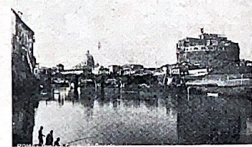
ROMA. — Castelul S. Angelo.

Prima surpriză avută, de îndată ce-am călcat