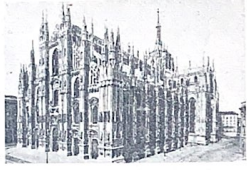
MILANO. — Domul.

Firenze a fost deosebită o etapă a excursiei. Patria lui Dante și a lui Leonardo da Vinci, ne-a impresionat și ne-a stârnit admirația cu monumentele importante ce se află aci. Drumul spre Roma ne-a fost numai o nerăbdare de a vedea această vestită cetate, care știm cu toții, că a jucat un rol extrem de însemnat în istoria universală. Și într'a-această realitate a corespuns așteptărilor. Am fost încântați de cetatea lui Romulus. Cele câteva zile petrecute aci, am fost ocupați cu vizitarea așezămintelor vechi. În primul rând, monumentala biserică a Sfântului Petru, ne-a prezentat capo-d'opere a multor artiști celebri. Clădirea însăși ne aduce