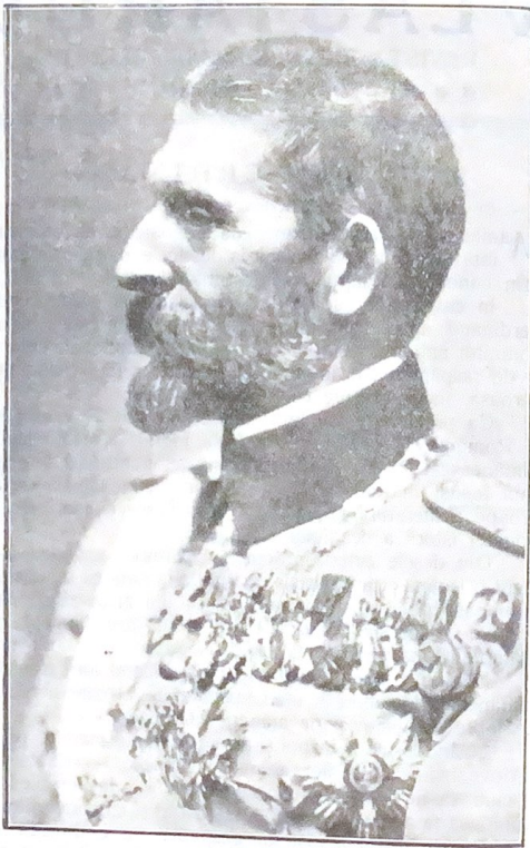
M. S. REGELE FERDINAND I

Regele Ferdinand e un rege național; el înțelege că nimic nu se poate face viu și trainic în viața unui stat, decât pe temelii naționale.